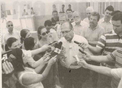
Alckmin visita conjunto habitacional e fala sobre projetos para a região da Serra do Mar